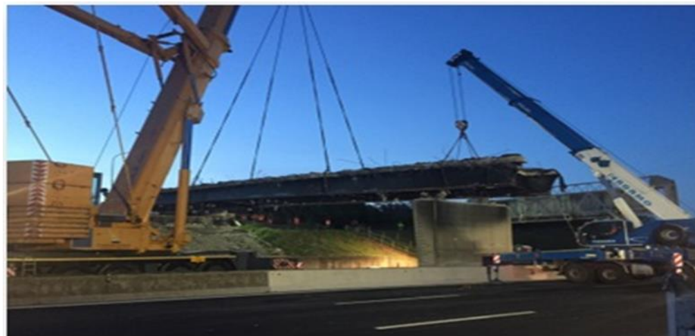
DEMOLIZIONE CAVALCAVIA N. 470 IN A1 KM 703+129 -