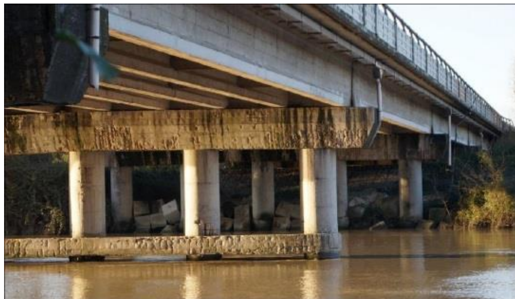
RIPRISTINO CORTICALE E STRUTTURALE DEL VIADOTTO TEVERE BAUCCHE AL KM 496+762 IN A1