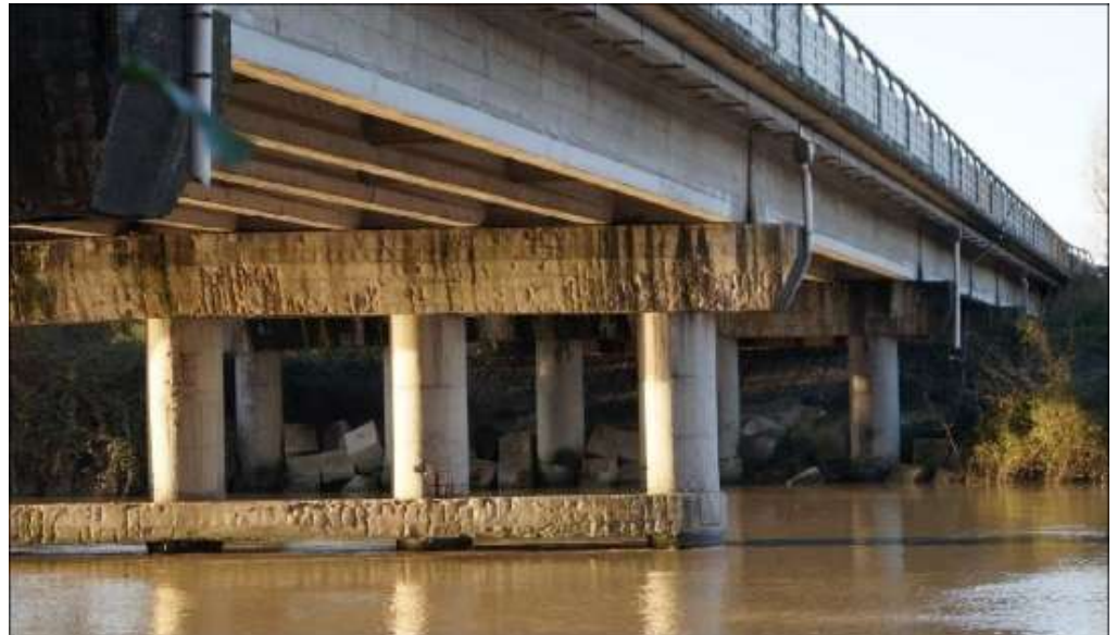
RIPRISTINO CORTICALE E STRUTTURALE DEL VIADOTTO TEVERE BAUCCHE AL KM 496+762 IN A1