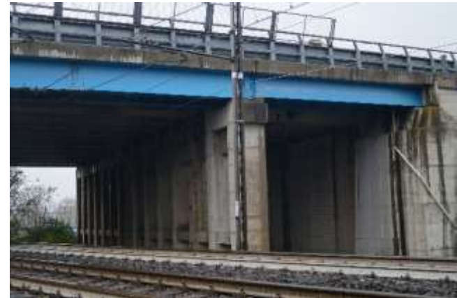
INTERVENTO DI RIPRISTINO DEL SOTTOVIA FERROVIARIO F.S. ORTE-ANCONA AL KM 491+384 IN A1.