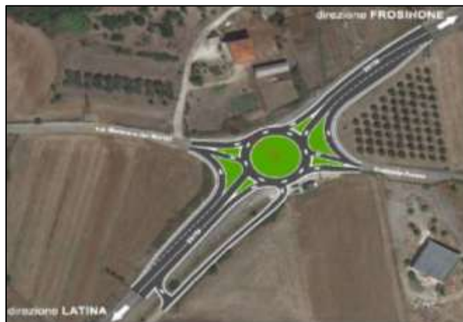
REALIZZAZIONE DI UNA NUOVA ROTATORIA INCROCIO AL KM 22+460 DELLA S.S.156 MONTI LEPINI