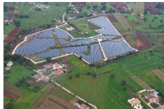
REALIZZAZIONE IMPIANTO FOTOVOLTAICO POTENZA 4,99MWp SUL TERRITORIO DI VILLA SANTA LUCIA (FR).