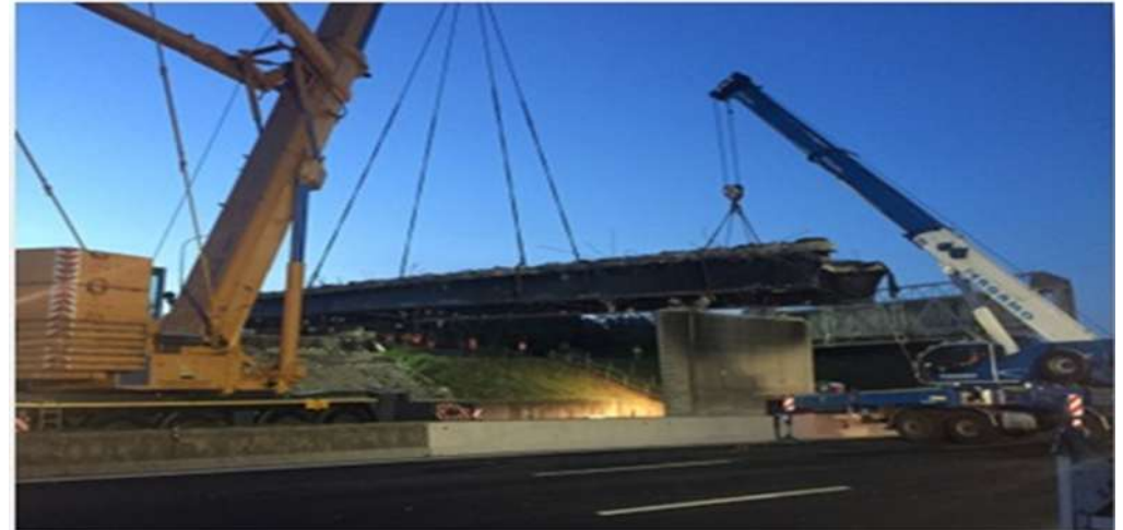
DEMOLIZIONE CAVALCAVIA N. 470 IN A1 KM 703+129 -